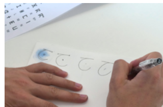
Vues d'un atelier Fanzine au Frac Nouvelle-Aquitaine MÉCA.

Depuis 1982, le Frac soutient la création contemporaine par la constitution d'une collection d'œuvres d'art pour la porter à la connaissance du plus grand nombre. Combinant ainsi des missions de diffusion et de médiation, de collection et de production au plus près des artistes, le Frac développe une programmation artistique avec un ensemble de partenaires sur le territoire qui se concrétise par des actions inventives et des moments à partager autour des œuvres.