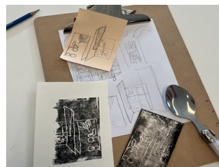
Vues d'un atelier Gravure commune au Frac Nouvelle-Aquitaine MÉCA. photo : DR, 2024.