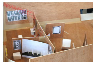
Vues d'une visite + atelier Maquette, ma quête : la fabrique de l'exposition au Frac Nouvelle-Aquitaine MÉCA.