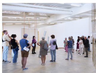
Vues de visites partagées lors des expositions temporaires au Frac Nouvelle-Aquitaine MÉCA.