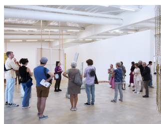
Vues de visites partagées lors des expositions temporaires au Frac Nouvelle-Aquitaine MÉCA.