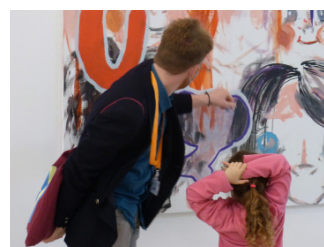
Vues de visites partagées lors des expositions temporaires au Frac Nouvelle-Aquitaine MÉCA. photo : DR, 2023.