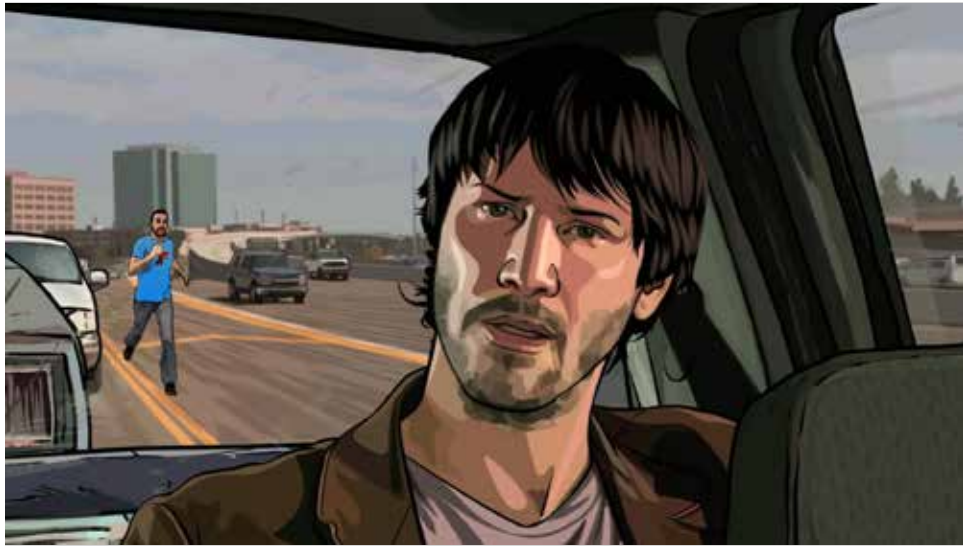
Arnaud Dezoteux, Dark Meta Reeves , 2016. Vidéo HD couleur, son, 28'. Collection du Frac Nouvelle-Aquitaine MÉCA.