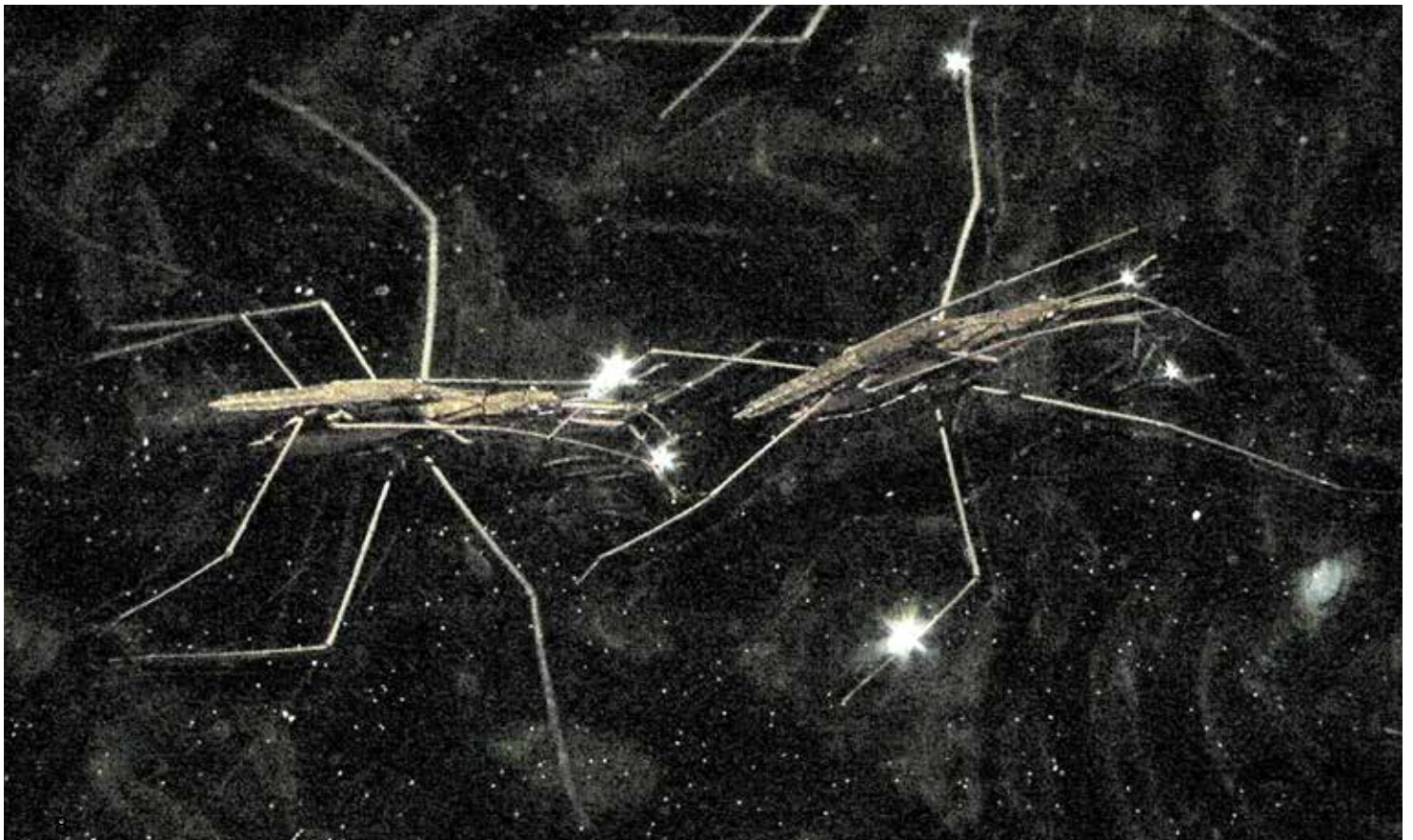
Anne-Charlotte Finel, Gerridae , 2020. Vidéo HD couleur, son, 4'11. Collection du Capc musée d'art contemporain de Bordeaux.