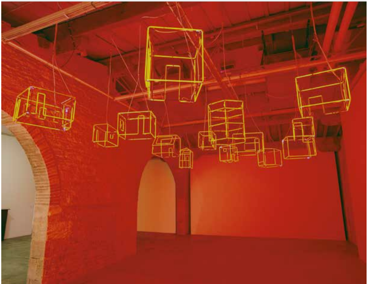
Sarkis, 14 lustres des Ateliers Brulés de Sarkis depuis 1956 , 1999/2000. Installation. Néon en cristal. Collection du Capc musée d'art contemporain de Bordeaux.