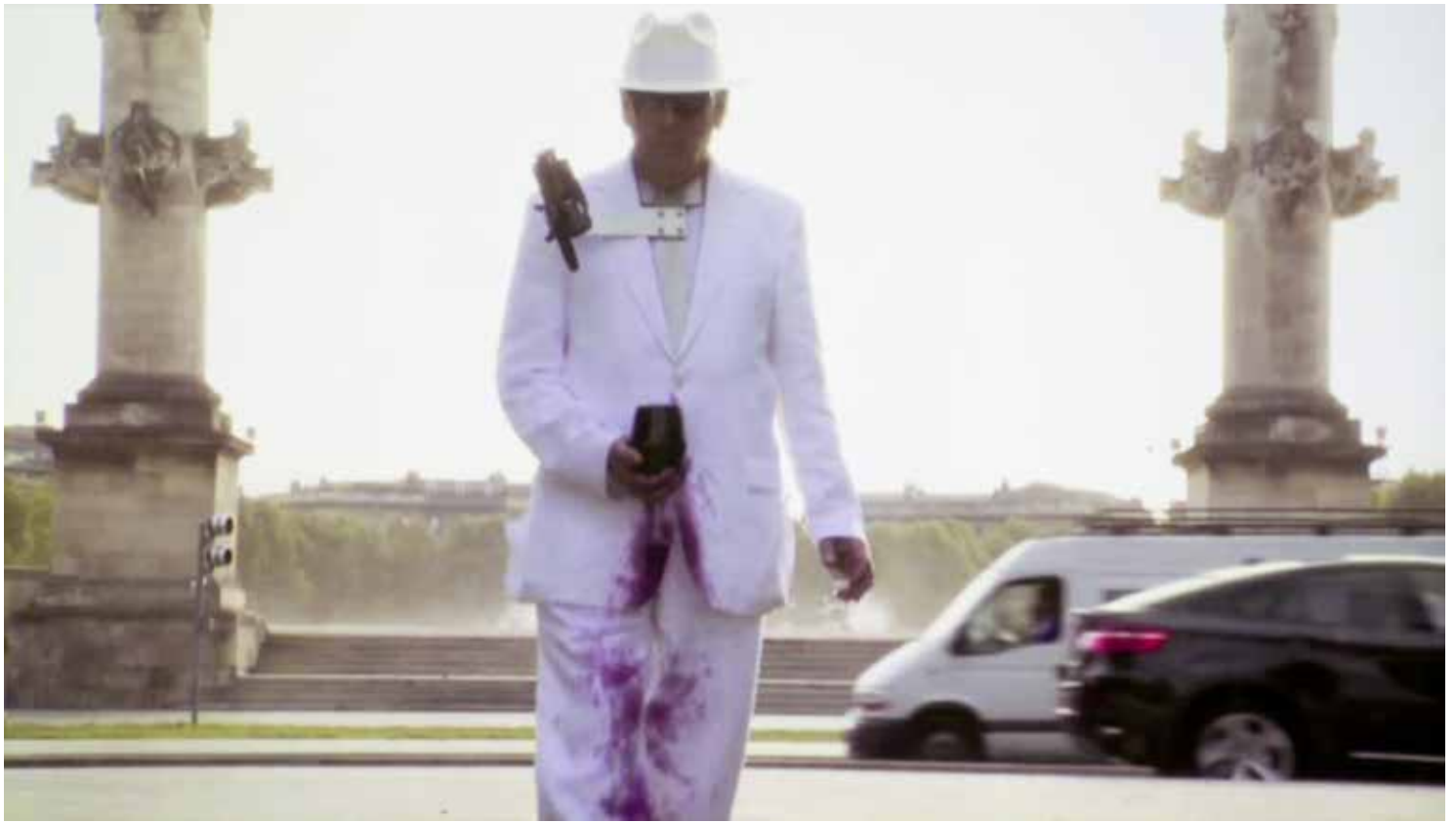
Dennis Adams, Spill , 2009. Vidéo HD couleur, son, 42'. Collection du Frac Nouvelle-Aquitaine MÉCA. ©Dennis Adams.