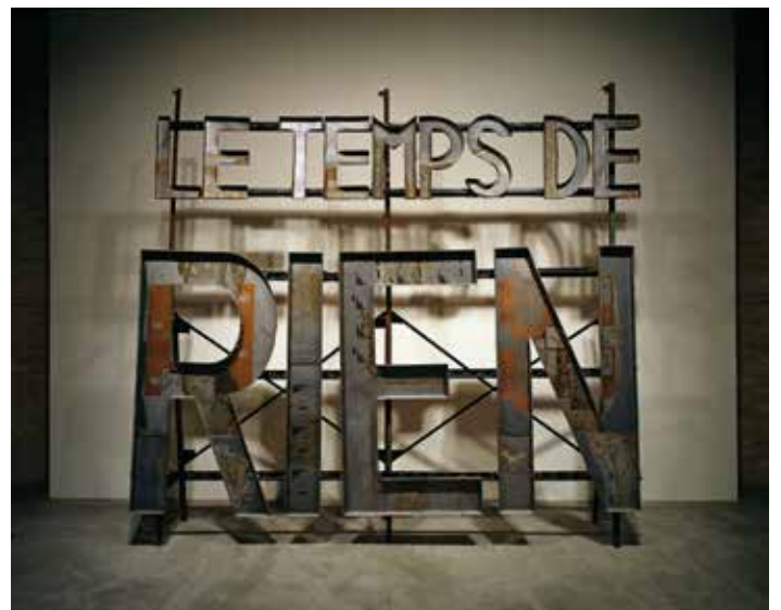
Richard Baquié, Sans titre , 1985. Métal, plaques d'imprimerie offset 310 x 325 x 55 cm. Collection du Capc musée d'art contemporain de Bordeaux.