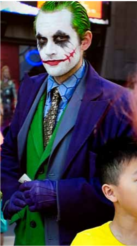
Marie Angeletti, Joker , 2014. Vidéo couleur HD en boucle, muet, 1'13. Collection du Frac Nouvelle-Aquitaine MÉCA. ©Marie Angeletti.