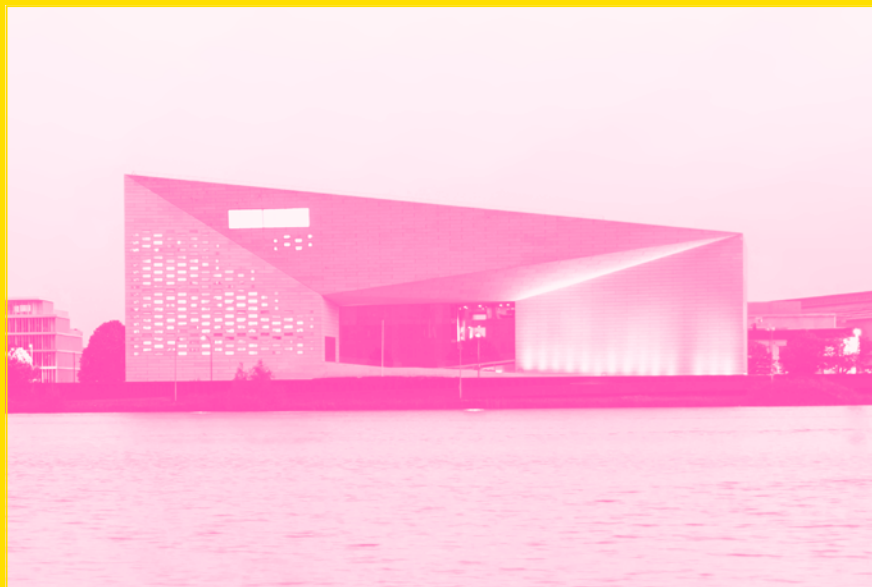
Ci-dessus : La MÉCA

Toute la programmation complète des événements www.fracnouvelleaquitaine- meca.fr et sur @fracmeca