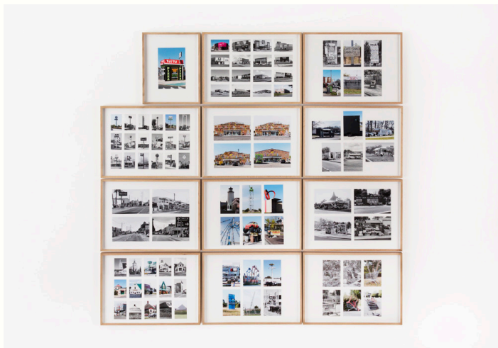
Camille Fallet, La Ville commerciale , ensemble Bordeaux sans légende, édition 1/3, 2017, collection Frac Nouvelle-Aquitaine MÉCA, photo : Jean-Christophe Garcia