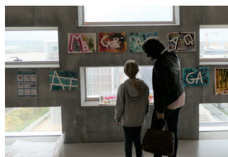
Prises de vues d'une visite-atelier « Peinture parlante » au Frac Nouvelle-Aquitaine MÉCA, 2020.