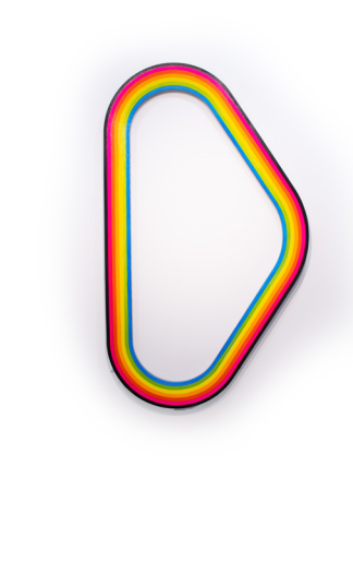
Prise de vue lors d'une visite de l'exposition Millénales. Peintures 2000-2020 au Frac Nouvelle-Aquitaine MÉCA, 2020.