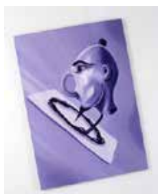
La Tête Violette , 1986 acrylique sur toile 135 x 110 cm Collection Frac Poitou-Charentes