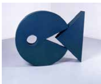
Le Pacman , 1984 contreplaqué peint 120 x 150 x 22 cm Collection Frac Poitou-Charentes