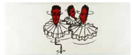
Une Bonne Haine , 1988 peinture sur papier 150 x 385 cm Collection Frac Poitou-Charentes