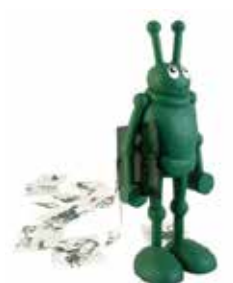
Le Martien (Carton à dessin) , 2000 polyester, peinture acrylique, carton à dessins 133 x 53 x 55 cm Collection Frac Poitou-Charentes