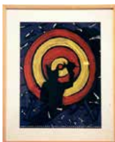
La Cible , 1997 acrylique sur papier 52 x 60 cm Collection Frac Poitou-Charentes