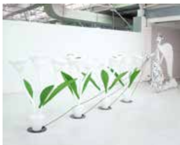
Les Fleurs carnivores , 1991-1993 Polyester, inox, médium, acrylique, moteurs électriques 250 x 840 x 180 cm Collection Frac Aquitaine