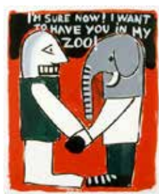
I'm sure now... I want to have you in my zoo , 1997 acrylique sur papier 55 x 46 cm Collection Frac Poitou-Charentes