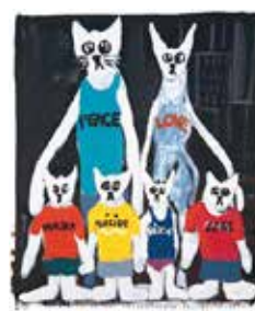
Peace, Love , 1997 acrylique sur papier 58,5 x 66 cm Collection Frac Poitou-Charentes