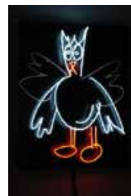
Volatile , 2003 Néons, plexiglas 103 x 85 x 15 cm Collection Frac Limousin