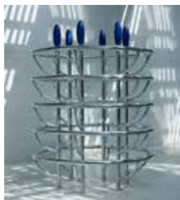
Les chromes , 1987 Acier chromé et polyester 270 x 203 cm Collection Frac Limousin