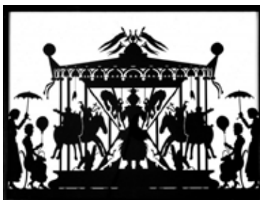
Petites découpes en papier noir , 1993 Papier noir découpé 4 x (31,5 x 41,5 cm) Collection Frac Limousin