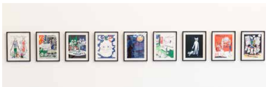
Petite Famille par temps gris... / Tu tourneras à gauche / C'est dégueulasse / GOD / Le Télescope / C'est bon, je peux effacer ? / Les Aveugles / More Sangria ? / DJ Barbe-Bleue novembre 1998 Stylo-feutre sur papier 9 x (32 x 24 cm) Collection Frac Aquitaine