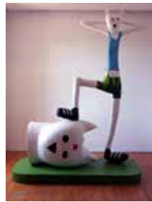
Le David , 1998 Résine polyester, bois, métal, peinture acrylique 293 x 235 x 125 cm Collection Frac Limousin