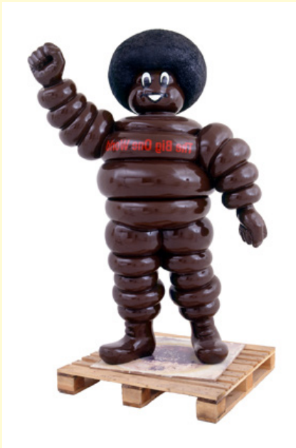
Bruno Peinado, The Big One World , 2000 Collection Frac Poitou-Charentes © PARIS, ADAGP Photo : Christian Vignaud

- Garder la trace : prendre une photo. Les cartes faites durant la visite scénarisée pourront être mises en ligne.